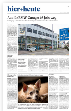
Bundauftakt 2. Bund*